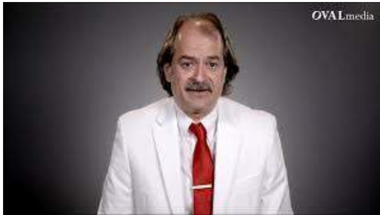
PROF. JOHN IOANNIDES