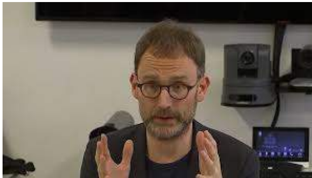
PROF. NEILL FERGUSON

Qui omnes influentiam prorsus falso ultraque omnem modum depinxerunt exaggeratam necnon nuntiaverunt istac influentiâ morituros esse aliquot miliones hominum. Sed illo tempore Wolfgang Wodarg adhuc potuit totam rem deflectere, quia potestate fuit politicâ, nam fuit membrum Conventûs Foederalis necnon Consilii Europaei. Ultimo autem momento temporis fieri potuit, ut homines rei verê periti audirentur – non solum una pars, ut nunc, sed etiam altera, idque factum est ultimo momento temporis, quo impediretur pessimum – nam animadversum est nullam prorsus esse pandemiam, sed nihil nisi influentiam mitem ideoque vaccinatio finita est. At hoc non iam factum est tempore aptissimo, nam spatio temporis interiecto propter vaccinationes, praesertim in Scandinavia, ni fallor, 1300 (mille trecenti) parvuli gravissimê sunt debilitati, per totam partem vitae suae reliquam laborabunt narcolepsi.