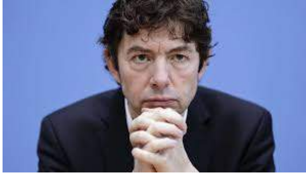
PROF. CHRISTIAN DROSTEN