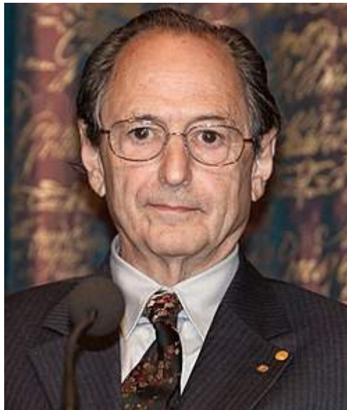
PROF. MICHAEL LEVITT